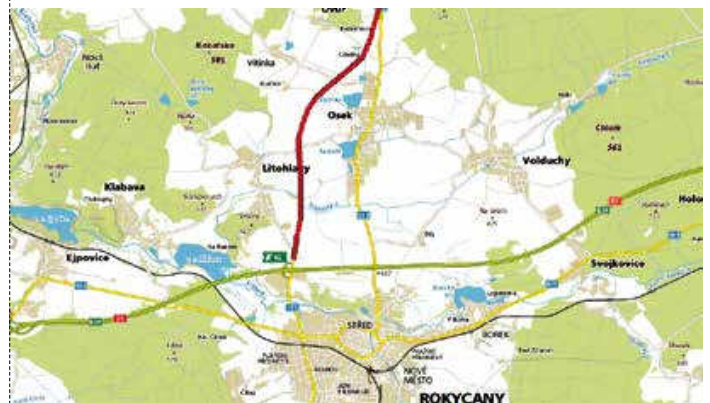
Napojení severního Rokycanska na D5

vykoupeno 61 % ploch. Na výkupy pozemků kraj uvolnil 55 milionů korun. I tato akce má prioritu v rozpočtových investicích. Předpoklad zprovoznění stavby je rok 2020 nebo 2021. Kromě výše zmiňovaných velkých akcí se chystají i další, rozsahem menší. Správa a údržba silnic v letošním roce vlastními prostředky nebo dodavatelsky zajišťuje opravy na dalších 100 stavbách.